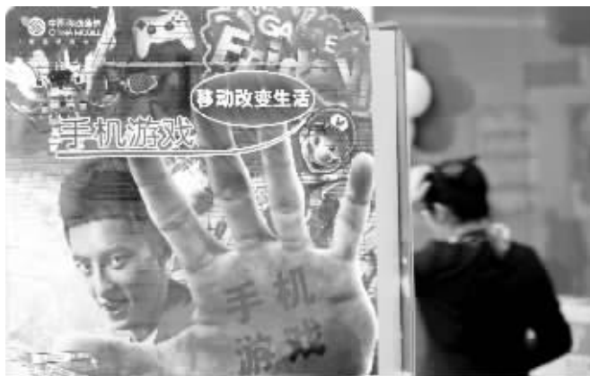
手机游戏日益红火也让不少股票“疯”了起来

昨日,手游概念股出现回调,仅浙报传媒、天音控股出现不同程度上涨,其余近10只股票纷纷下跌,欧比特、顺网科技、美盛文化跌幅均超5%。