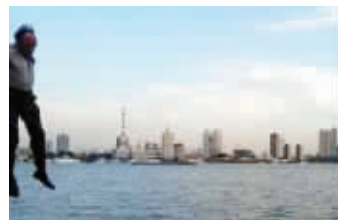
乘客无意中拍下事发瞬间