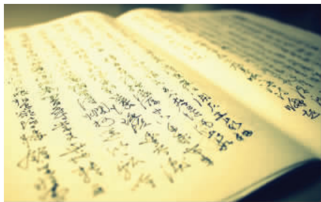
南大易高杰编纂的文集《予心录》