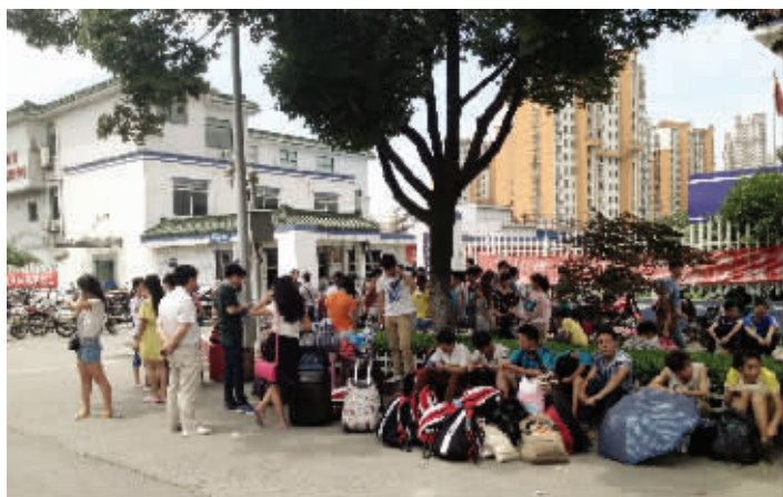
大热天,学生等在路边讨说法