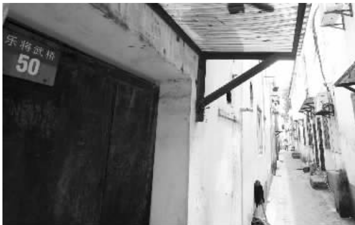
路两侧没有路灯,没有星光的晚上,行人很可能被凸起的台阶和石墩绊倒