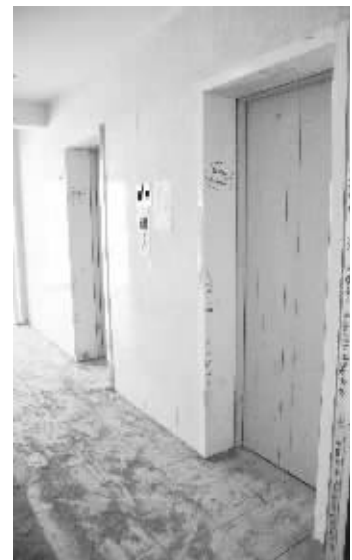
发生下坠的电梯,地面上散落着不少水泥

对于姑苏区委宣传部官微通报的事故原因,苏州市质监局特种设备安全监察处工作人员予以了认可。他告诉记者,苏州市质监局已向姑苏区政府发函,告知其加强南环新村的物业管理,今后禁止居民将裸露的黄沙、水泥等建筑材料直接搬入电梯中。目前,南环新村的所有电梯都在进行安全检测,暂未发现问题。