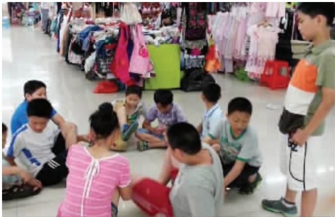
孩子们把市场当成日托所