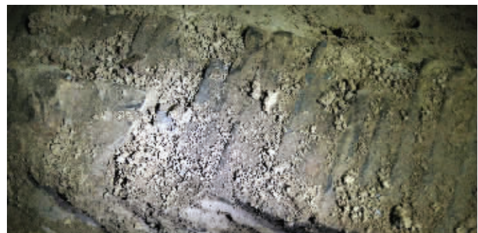
考古现场,被挖后裸露在外的青砖

不过,墓主生活的年代,不是东晋,而是南朝。据介绍,古墓有青砖垒砌,青砖上有莲花纹。“由于南朝佛教兴盛,因此莲花纹备受欢迎,不少建筑上都有莲花纹,很多南朝墓的墓砖上都有莲花纹。而且是各种莲花纹,有单瓣莲花纹,也有多组拼凑起来的。”考古人员说,莲花纹砖可以判断年代,而且,这种砖垒砌的古墓,本身就是一种身份的象征。非官即富。尽管古墓有些寒酸,但历史价值很高。据介绍,古墓将被整体保护起来。