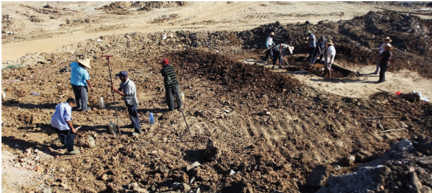
燕子矶一工地内的考古现场,工人们正顶着烈日认真挖掘