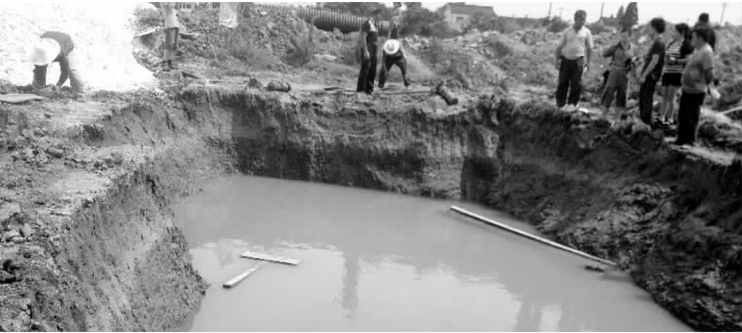
这个不大的水坑“吞噬”了两名十来岁的少年

武进夏溪的杨建明怎么也想不到,一夜之间,他和12岁的儿子小宁竟然阴阳相隔。7月2日一早,小宁和14岁的表哥小波,被发现溺亡在一工地的水坑中。记者从常州警方了解到,今年1至6月份,有关溺亡警情有38起,当天上午,武进警方也发布安全提示称,6月份武进区发生多起溺水身亡事故,溺亡者最小年龄仅4岁。