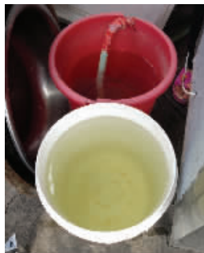
居民将发黄的自来水沉淀

阳西路上的几个小区进行走访,居民普遍反映家里的水都出现了发黄现象。在矿山院家属区内,一位小伙子正在小区里从一台直饮水机上打水,他告诉记者,不知道水色发黄的原因,这几天家里都不敢吃自来水。