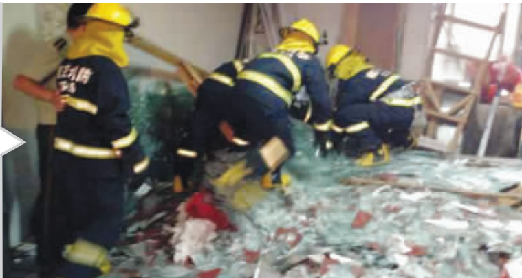
消防队员在现场施救