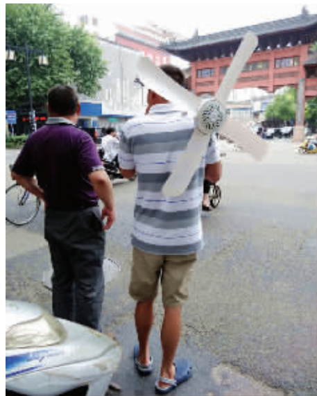
5.把握夏天的每一分钟,时刻享受电扇带来的风。不扛着电扇,怎么能凉快,没有人能随便享受。6月30日摄于夫子庙