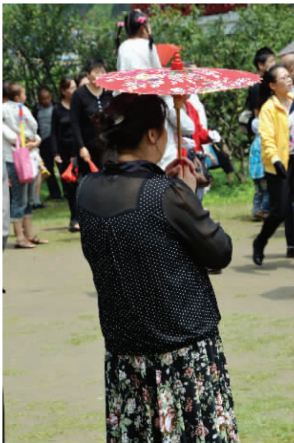
1.在我心中,曾经有一个梦,要让身材标准到能缩进伞中。 6月12日摄于莫愁湖