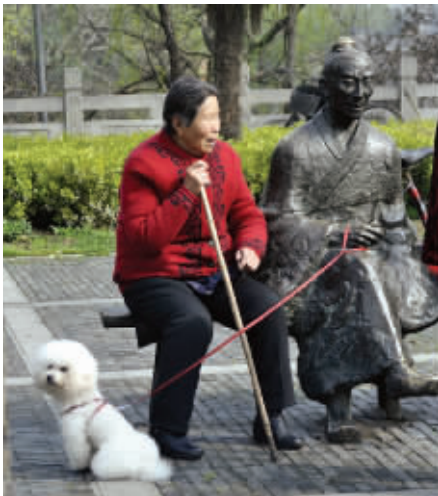
2.灿烂星空,谁是真的英雄,遛狗的大哥给我最多感动。摄于东水关公园