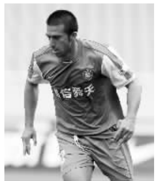
达十，舜天球迷想死你了