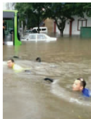
游泳是人生必备技能