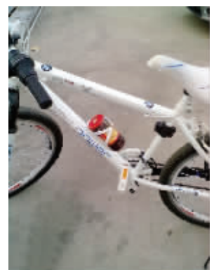
渴了来一瓶老干妈,爽