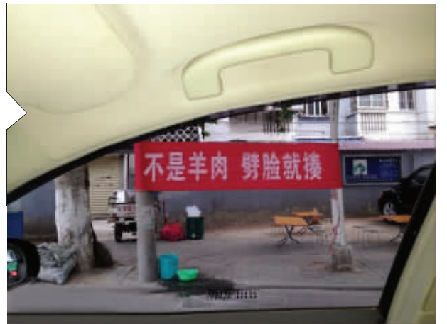
都是假羊肉给害的