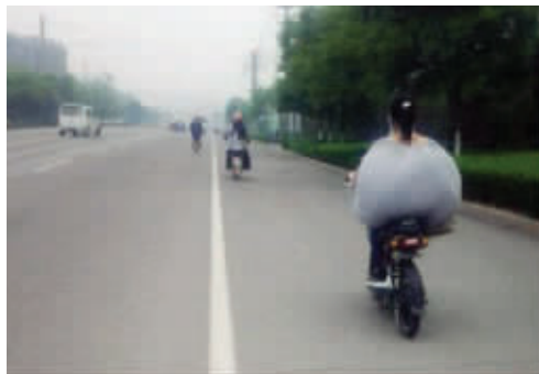
美女,你的衣服好兜风