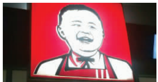
这孩子的笑容吓死爹了