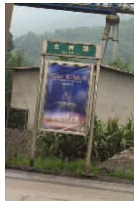
期待“屌丝路”的出现