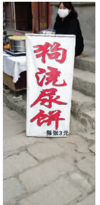
你这烧饼卖得出去吗