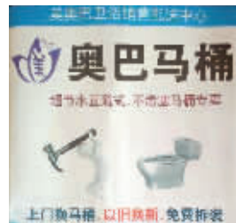
奥巴马表示压力很大