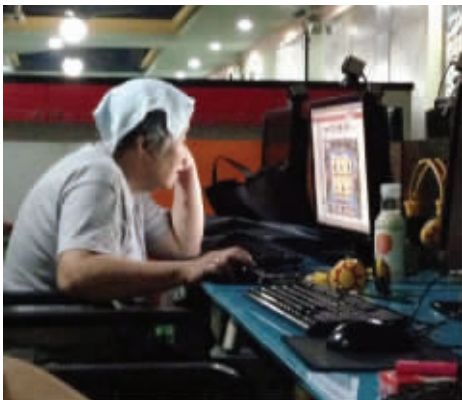
大妈,你哪个战队的