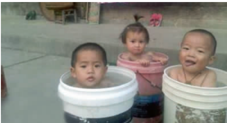
我和我的小伙伴们都爽呆了