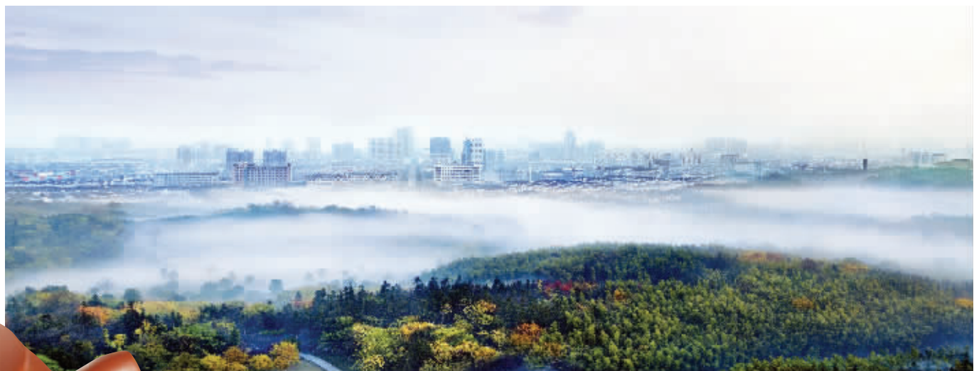
龙背灵气漫荆溪

宜兴地处太湖之滨，苏浙皖三省交界和沪宁杭三角中心，是中国著名陶都和太湖风景区的旅游城市，也是国家历史文化名城、中国优秀旅游城市、国家园林城市、国家卫生城市、国家生态市和国家环境保护模范城市。随着宁杭高铁通车，宜兴迎来历史上首趟客运列车停靠。宜兴站停靠列车达76列，是沿线县级市站点中，停靠班次最多的站点。