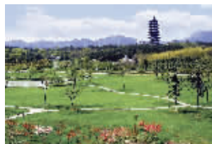
宜兴龙背山森林公园