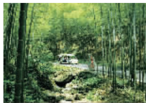
宜兴竹海

城里人喜爱的农家乐集中在湖父镇、西渚镇和太华镇。兴望生态园、根大生态园、华东百畅生态园、杜鹃花基地、阳羡茶文化园、紫砂村等各具特色。