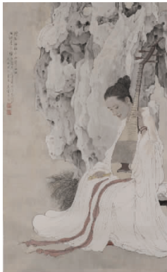
高云《未成曲调先有情》