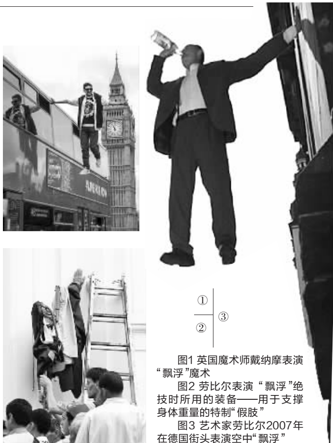
图1 英国魔术师戴纳摩表演“飘浮”魔术

2011年,戴纳摩曾当着数百万观众的面,在没有辅助装置的情况下,如蜻蜓点水般在水上自由行走,“徒步穿越”泰晤士河。有人猜测,戴纳摩表演前可能让人在河面铺设高强度的玻璃支架,足以支撑一个成年男子的体重。同时利用光线折射,让肉眼根本看不出水下面有支撑物。