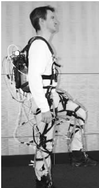
哈佛大学正在研制的新型机械服