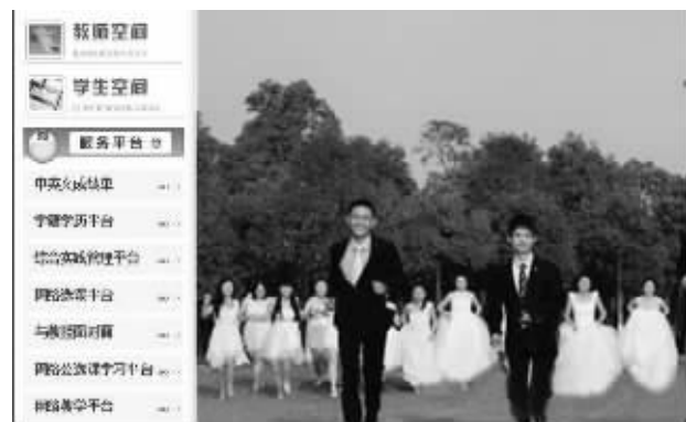
网上晒出的“婚纱毕业照”

这两天,全国各地纷纷放榜,南京各大高校也进入招生季,为了招生,各大高校纷纷使出“绝招”,汉子、妹纸都成了“炫耀”的资本。