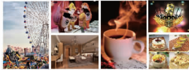
礼品以实物为准,活动详情见店堂公告

活动期间(7月6日-7月7日),购家居建材产品单品消费实付3000元即可获得“体验套餐”乐享弘阳广场55万平米至尊服务。