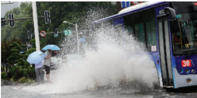
公交车,大波浪