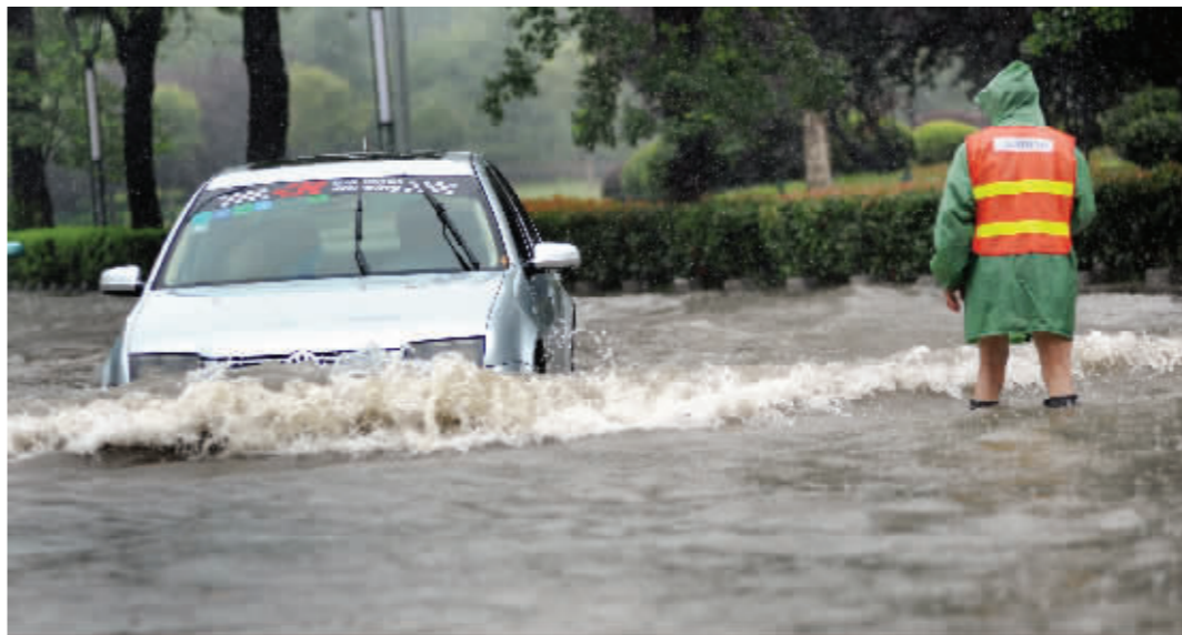
市区不少地方积水严重,给出行市民带来了不便

昨天南京大雨倾盆,中小学生的情况如何?现代快报记者了解到,小学生已经基本完成期末考试放假在家,中学生正在进行期末考试,目前没有学校因大雨停课。昨天,南京市教育局下发《关于做好梅雨季节学校安全工作的紧急通知》,并要求各区教育局迅速把此通知传达到所属中小学。通知特别强调,如遇大雨暴雨,学校可以变更放学时间,甚至停课。