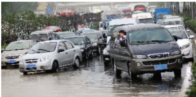
南京幕府东路上积水严重,车辆严重积压