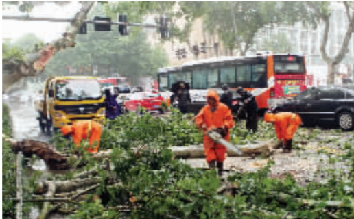
长江路一棵大树倒伏,工作人员快速抢修