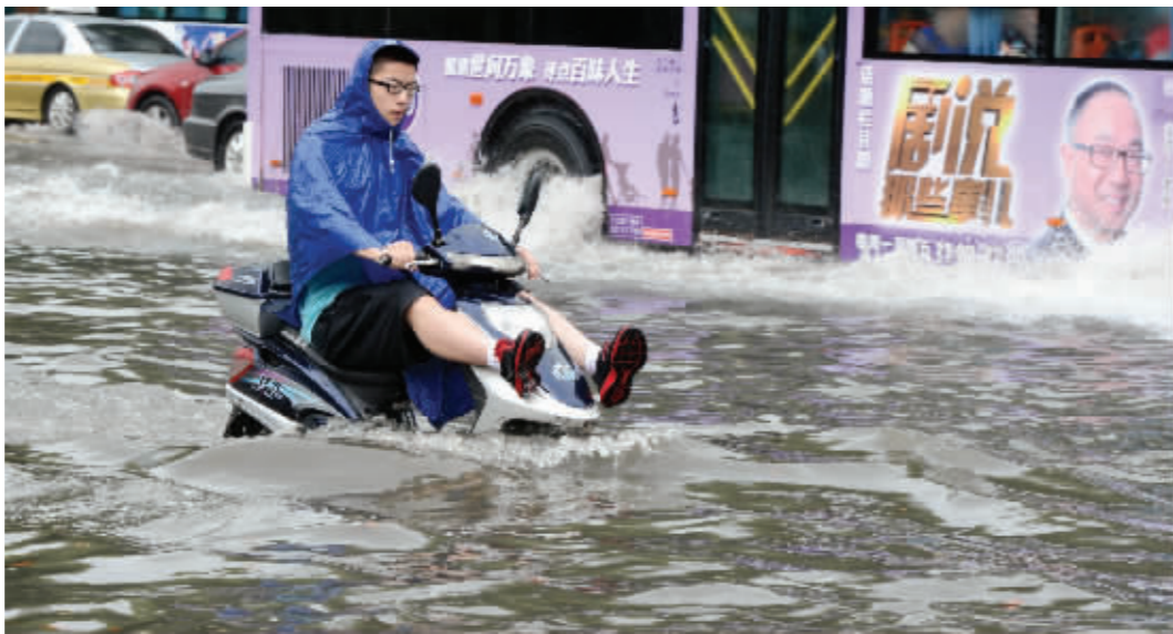
玄武门,滑浪

我们形容雨量大小,一般都是用毫米来衡量。1毫米的降雨量,表示在没有蒸发、流失、渗透的平面上,积累了1毫米深的水。就1平方米的地板砖来说,1毫米的降雨量相当于在上面倒了1千克的水,也就是两瓶日常喝的500毫升纯净水那么多。昨天南京城区雨量多在100毫米,也就是说,每平方米被浇了200瓶矿泉水!