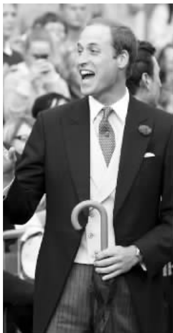
威廉同时遇到6个前女友,不知道心里是啥滋味