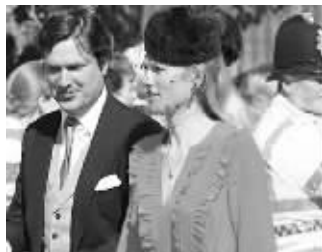
达维娜·达克沃斯-查得 (威廉前女友,34岁)

杰卡的家族是肯尼亚的白人贵族。2003年曾有报道称,威廉在前往杰卡家肯尼亚野生动物保护区游玩的过程中,与杰卡擦出了火花。2012年,据称杰卡跟几度分分合合的男友、风险资本家休·克罗斯利再度复合。