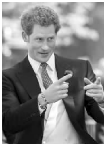
哈里也遇到了两名前女友,更尴尬的是,他的现女友也在场