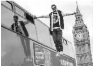
迪纳摩手扶巴士,飘在空中

据英国《每日邮报》报道,出生在英国布拉德福德的魔术师迪纳摩总是会带来一些能让人目瞪口呆的魔术。日前他在伦敦表演的只用一只手按着4米多高的双层巴士、全身悬空的飘浮魔术,让不少观众吃惊得张大嘴巴,连下巴都差点掉了下来。