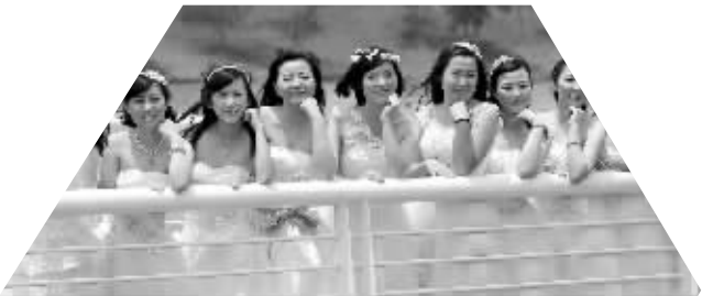
女生们的集体婚纱照