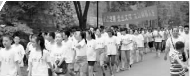
258个孩子用“走湖”来告别小学生涯