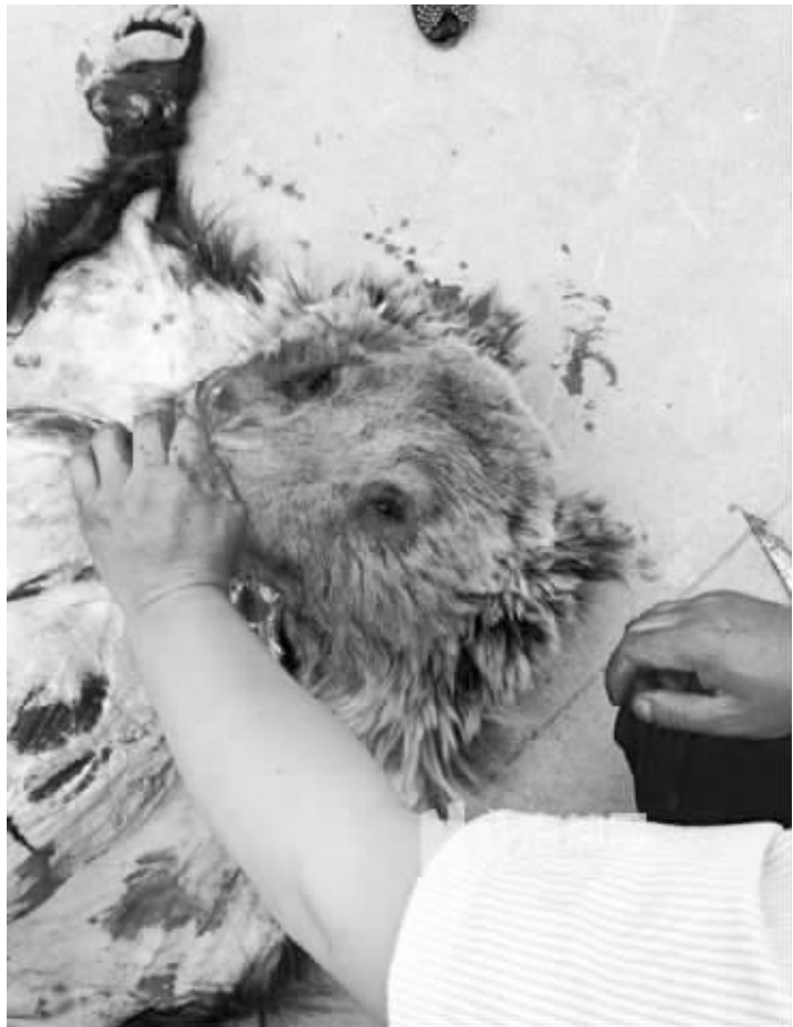
网友所发熊被剥皮的照片,以为熊是被杀害的

记者从青海省相关部门获悉,近日网络疯传的“德令哈市一棕熊被残忍杀害”事件实为森林公安干警和牧民,共同对熊进行控制过程中处理不当造成熊窒息死亡。