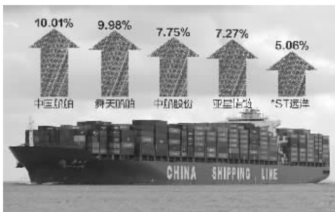
昨日部分船舶股涨幅 制图 李荣荣

在流动性退潮,基本面疲弱,改革红利遥远的市场环境下,大盘难以形成有效的方向性选择。而与此同时,代表经济转型方向的创业板和中小板部分个股遭到热捧。创业板指数也在昨日盘中创出新高。分析师表示,不得不注意的是,随着资金面的继续紧张,成长股的补跌也难以避免。后期通过半年报的“中考”,部分无业绩支撑的高估值成长股将回落。