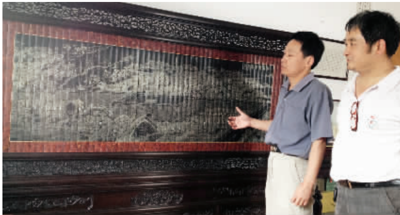
这幅《姑苏繁华图》消耗了2500多米银丝,“阊门”两个字用金丝镶嵌

描绘乾隆时期苏州城内外景象的《姑苏繁华图》,近年来在能工巧匠的手中有了多种形式的呈现,有刺绣版、漆刻版等等。日前,桃花坞的两位民间工艺高手又成功完成了金银丝镶嵌版的《姑苏繁华图》中的“阊门”一景。昨天下午,记者在位于河沿街81号的“冯振兴”老作坊里看到了这幅作品。