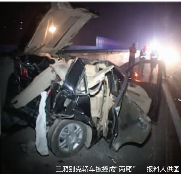
三厢别克轿车被撞成“两厢”