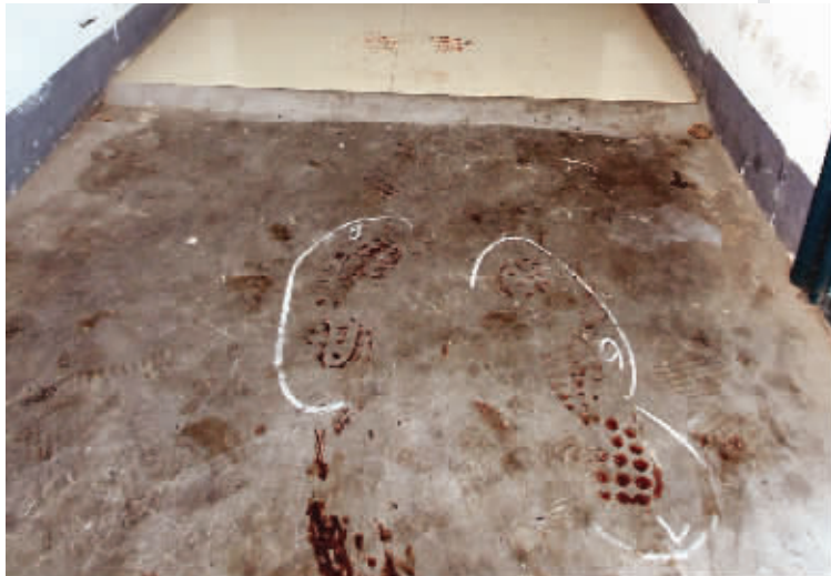
现场虽然经过清理,但依然可见血迹