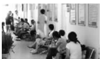
子宫颈疾病患者最高现金医疗补贴达800元

目前妇科微创手术实现了从住院到门诊、治疗时间从数个小时缩短至几十分钟、从长疤痕到无疤痕,尤其自媒体报道《手术背后风险究竟有多大》后,越来越多的患者主动要求接受微创手术。据悉,在南京454医院,约70%的妇科病可通过微创手术治疗,其具有“不开腹、疼痛极