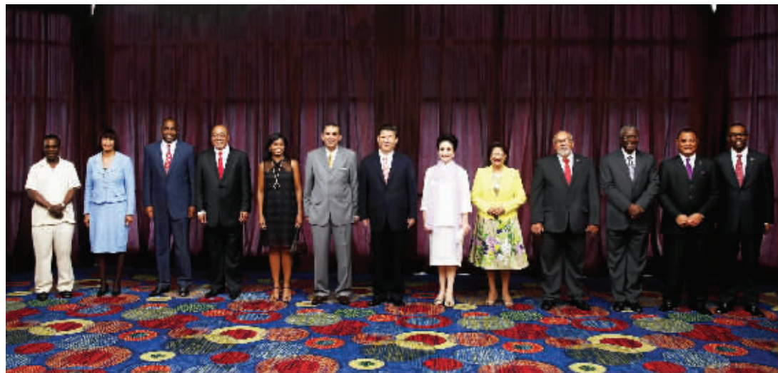
6月2日,正在对特立尼达和多巴哥进行国事访问的国家主席习近平在西班牙港为加勒比国家领导人举行午宴。这是午宴开始前习近平和夫人彭丽媛同加勒比国家领导人合影