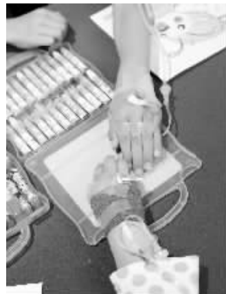
图上为普通针,图下为留置针

有了钢质针芯对血管壁的硬性损伤,提高了穿刺成功率,避免反复穿刺,减轻患儿痛苦和对输液的巨大恐惧,有效保护患儿血管。