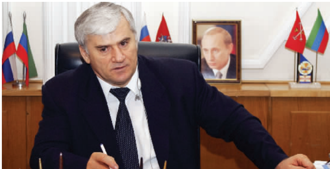
2005年9月22日,俄罗斯南部达吉斯坦共和国首府马哈奇卡拉市市长赛义德·阿米罗夫在办公室

俄罗斯联邦当局6月1日派遣士兵,抓捕南部达吉斯坦共和国首府马哈奇卡拉市市长赛义德·阿米罗夫,指控他下令谋杀一名调查部门要员。