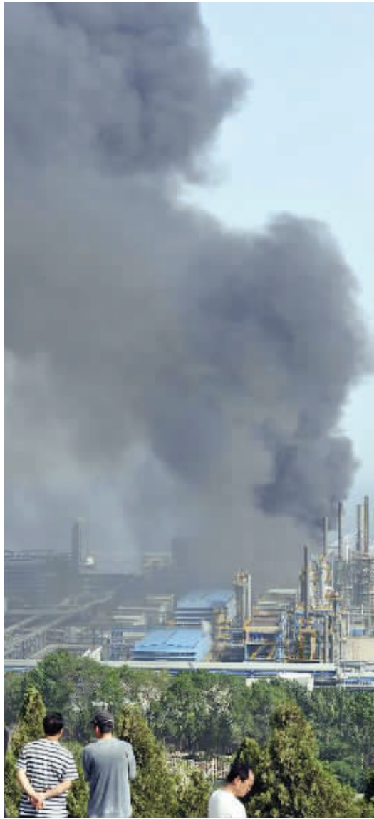
爆炸现场浓烟冲天

根据大连市环保部门现场实时监测,附近海域目前尚未受到污染。记者注意到,工厂附近海域已经预防性地铺设了多处围油栏。