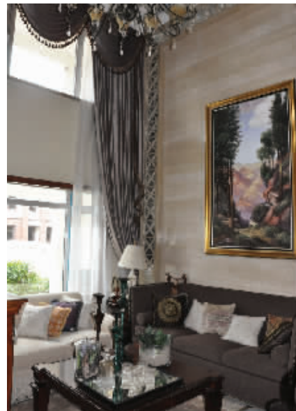
紫金东郡实景样板房

紫金东郡的双地铁优势迎合了多数崇尚“低碳生活”的购房者,搭乘地铁25分钟直达新街口,除此之外,凭借咫尺紫金山的天赋优势,紫金东郡坐享顶级资源及生活配套,目前南一幼已正式入驻,预计10月开园,下一个儿童节,也许来紫金东郡过儿童节的家庭会更多。