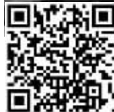
扫描二维码,看老耿介绍玩石心得