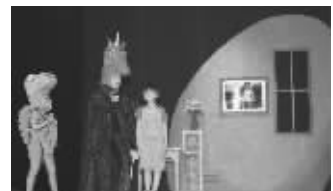
“蛋蛋圆梦记”演出中