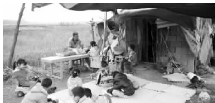
“麦田爸爸”在帮脑瘫儿做康复训练

邳州法院执行庭的一位王姓庭长告诉记者,东博老年公寓因为一场医疗纠纷和一起工程款纠纷,需要赔偿患者家属大笔资金,而被法院强制执行,同时将康复中心列为协作执行对象,希望能拿到租金支付给患者家属。“但是从去年到现在,我