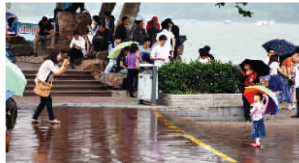
人生,要学会抓住机遇,趁着下雨时这湖光山色,波光水影,赶紧抓拍一张美丽小女孩。