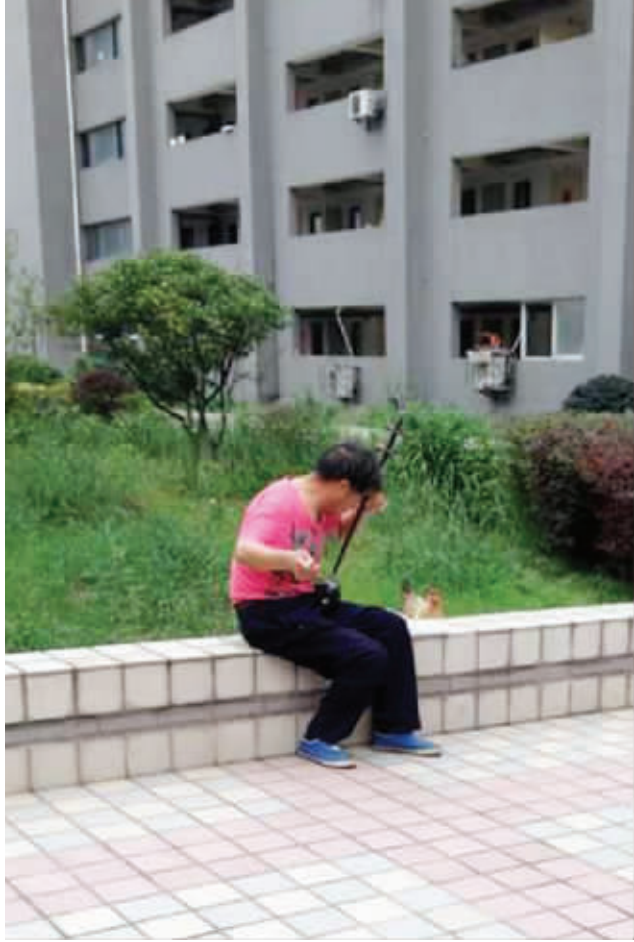
人生,要耐得住寂寞,即使身边没有一个人,还是要拉琴,终究还是有一个听众:一曲肝肠断,天涯何处觅知音!(想起星爷没?) 5月23日摄于浦口某小区