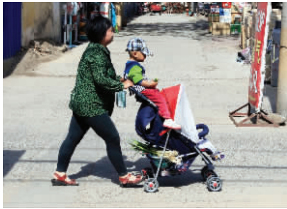
人生,重在选择。拼着被太阳晒黑,换来“高人一等”,这感觉好极了。5月12日摄