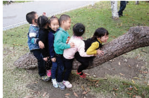
人生,贵在知足常乐。就像这6个宝贝,骑在一棵歪脖子树上,也很欢乐。