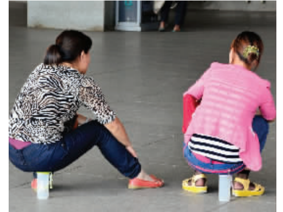
人生,重在选择。如果是我的话,起来之后也不会再用这杯子喝水了。5月22日摄于南京站