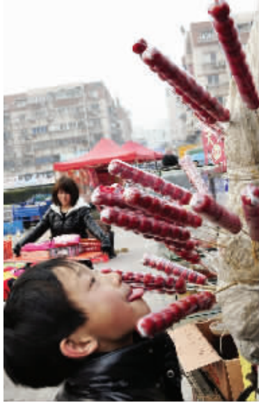
人生,要经得起诱惑!这谁家孩子,没给钱可不能直接舔啊!5月3日摄