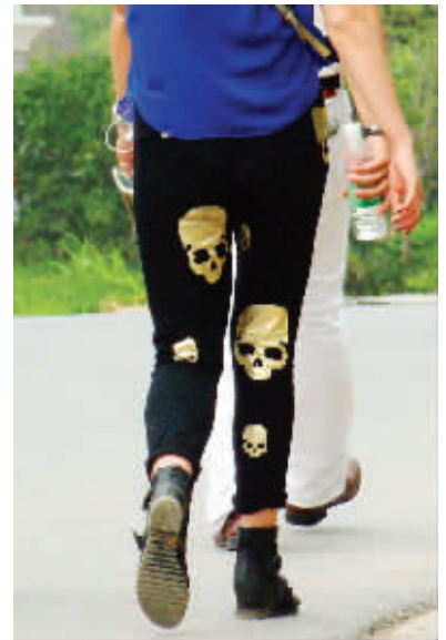
人生,要经得住风雨,再多的骷髅头瞪你,也要勇敢地跟上去,提醒她不带这么吓人的。5月23日摄于方山