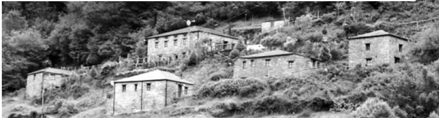
超便宜的西班牙小村庄

受经济不景气等多种因素影响,西班牙一些破败的小村庄以“白菜价”出现在市场上,吸引不少外国人,特别是英国中老年人抢购。