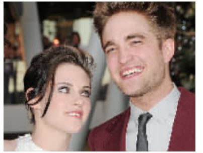
昔日爱侣分道扬镳

罗伯特·帕丁森本月13日度过27岁生日,克里斯汀并没有陪伴在他左右。根据美国媒体报道,实际上两人最近在感情上出现了很多问题,而且“经常吵架”。就在帕丁森生日前的一周,两人还为一些事情吵个不休,后来双方一直在赌气。