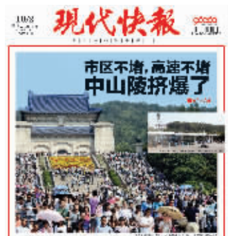
去年国庆期间, 中山陵被挤爆

于是, 为了进一步优化景区交通组织, 中山陵园管理局邀请了南京泛华设计院的专家, 制定中山陵园风景区旅游交通规划。