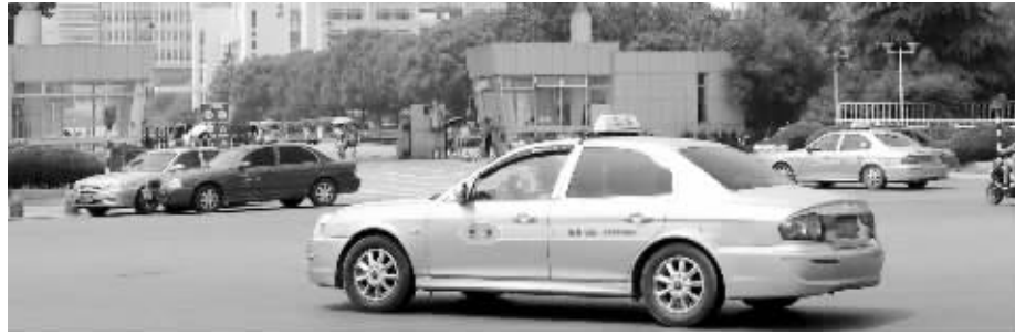
出租车聚集的高校门口,曾是黑车的“地盘”