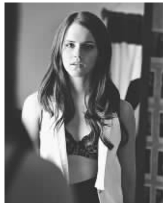
艾玛·沃特森在影片《珠光宝气》中的镜头