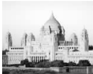
焦特布尔王宫的宫殿