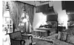
宫殿被改成豪华宾馆

据美国有线新闻网(CNN)报道 吊桥、护城河、炮塔,只有中世纪的宫殿才会有这些防御工事,他们主要的作用是保护宫殿在遭遇外敌攻击时能将敌人拒之门外。但在印度焦特布尔,一座有着防御工事的华丽宫殿却大开四门,欢迎来自全球各地的人们前来入住。因为,这座宫殿已经被改造成成了一个宾馆。