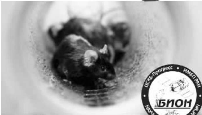
太空实验舱(上)和实验鼠

提的是,尽管45只被送入轨道的小鼠中的大部分(再加上所有沙鼠和15只壁虎)在实验过程中死亡,但它们还是带回了珍贵的数据。国家航天研究中心生命科学部主任吉耶梅特·戈克兰·科克表示,这一科研项目“在人类适应失重领域又迈出了关键一步”。