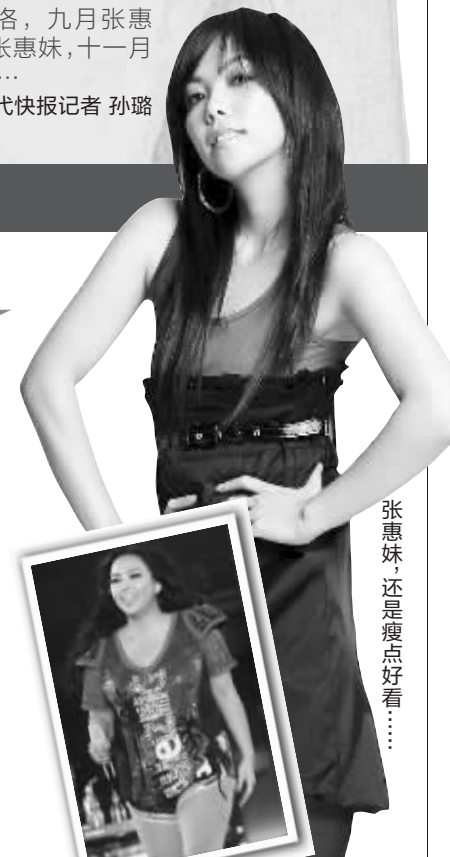
张惠妹,还是瘦点好看……

逝去的是青春,留下的是臃肿。有网友不禁暗暗担忧,基努有了双下巴,小李子有了皱纹,裘·德洛秃了顶,以后还看谁?有网友臆想:“如果他们都是从现在的胖子变回以前的美女帅哥,那该是多好的风景啊!”而一些苦于减肥的人却很开心,“看了图片平衡啦,原来不努力控制,明星也无法保持体形。”