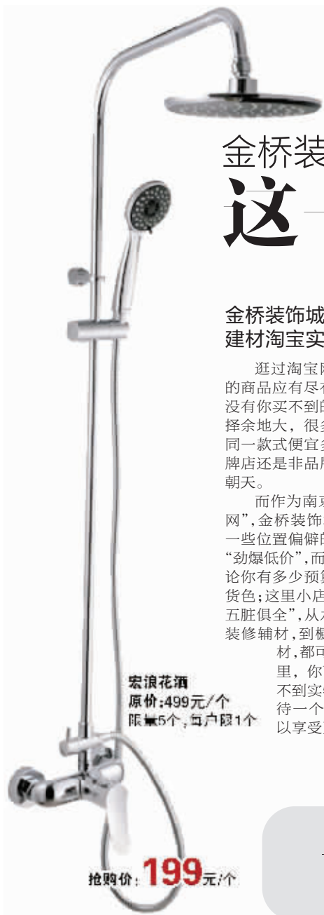
宏浪花洒 原价:499元/个 限量5个,每户限1个

报名热线:025-85069330 短信报名:13675109942(姓名+楼盘)