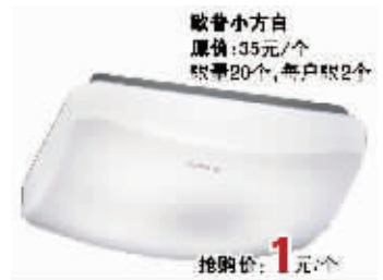
欧普小方白 原价:35元/个 限量20个,每户限2个