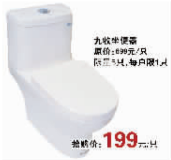
九牧坐便器 原价:899元/只 限量5只,每户限1只

据了解,金桥装饰城的低价模式不同于其他尾单、处理货促销,许多产品都是不限量供应,在许多热销产品上都进行薄利多销,真正让利于消费者。小到管材、电线、螺丝,大到板材、五金、洁具等应有尽有,其中更不乏马可波罗、圣象、九牧等众多一线品牌。从钉子到木工板,从卫浴到电器,在这里都可以以“批发价”一站式买齐。