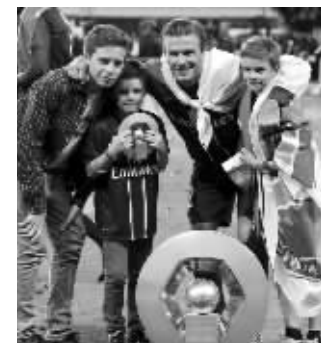
贝克汉姆和三个儿子享受欢乐的时光