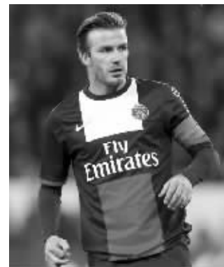
贝克汉姆戴上队长袖标

上场85分钟,全队最高的71次传球,其中成功60次,38岁的贝克汉姆宝刀不老,难怪《每日邮报》也有点不舍:“现在说服贝克汉姆留下是不是晚了些?助攻太漂亮了!”