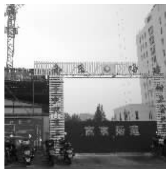
正在紧张赶工的施工现场