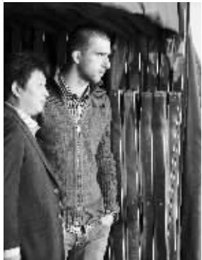
达纳拉赫现场观战