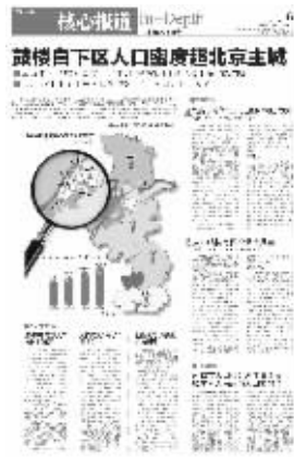
快报去年的相关报道

今年南京进行了区划调整,白下与秦淮,鼓楼与下关合并后,新鼓楼区人口密度降为2.43万人/平方公里,与北京西城区相当,位列上海的虹口区和黄浦区、广州越秀区、北京西城区之后,排名老五。新秦淮区人口密度降为2.10万人/平方公里,与北京东城区相当,排行老七。