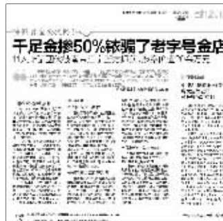
现代快报4月19日相关报道