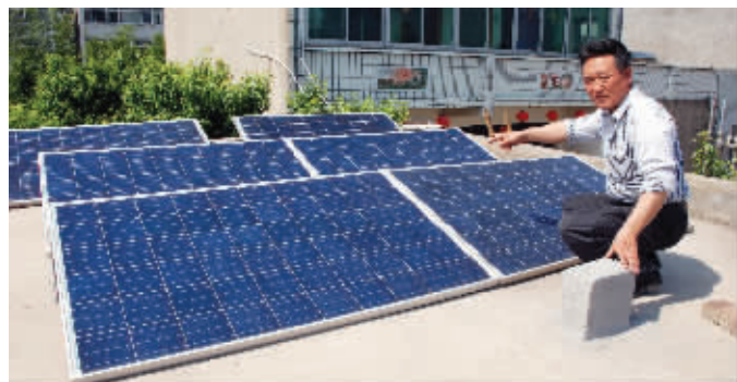
张长旗家屋顶上的光伏电池板

烧饭、给电瓶车充电……泰兴农民张长旗家用电实现了自给自足,家庭每天所需的电力来自一套自己研究安装的分布式光伏发电系统。让张长旗苦恼的是,这套系统全部开启的话每天能发25度电,一家人根本用不掉。张长旗有个愿望,自家发的电能并入国家电网,将电卖给国家,也能避免能源浪费。