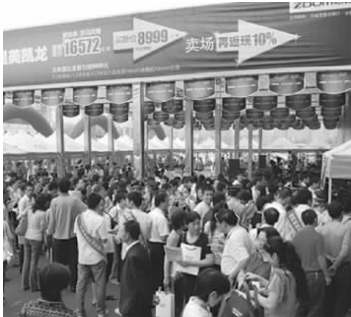
志邦厨柜往年签售现场盛况

一个是家喻户晓的家居卖场巨头,一个是专注于厨房15年的一线橱柜品牌。下周六(5月25日)10:00~12:00,强强联手,打造志邦厨柜&红星·美凯龙专场联合团购会。在这场专场团购会中,志邦和红星的两大总裁联合签售,将给出年度超大优惠,而这样的优惠全年只有一次,一次只有两个小时。现在起,快报将开通96060绿色报名通道,带领读者本周六提前探店。