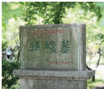
孙权墓位于明孝陵侧

张岱前去游玩时,明孝陵建成已有200多年。张岱看到,孝陵的殓殿内,供奉有成祖生母碯妃的位子。张岱由此想到皇宫的一段秘闻:成祖本是碯妃的儿子,但他出生后,却被孝慈皇后(马皇后)秘密地据为己有,很长一段时间里,成祖的身世不为人知。