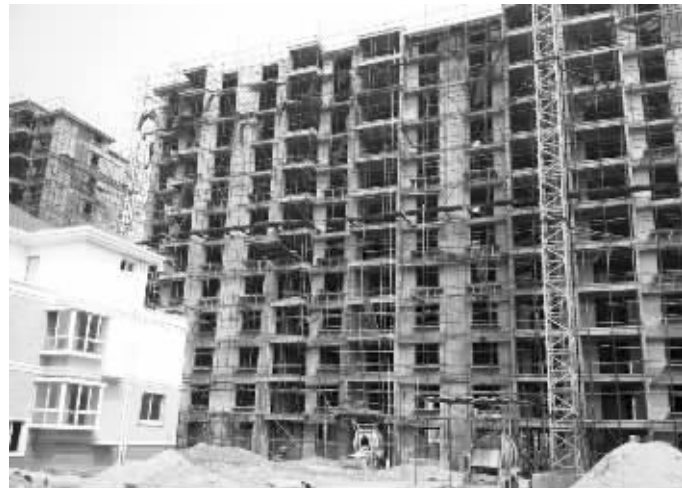
新沂这个烂尾楼盘不知何时才能复工