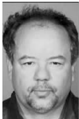
嫌疑人阿列尔·卡斯特罗