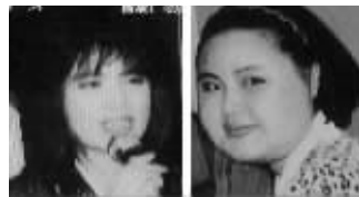
持续整容使脸部增大