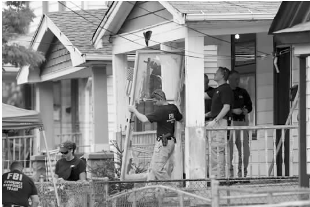
调查人员正在现场搜集证据